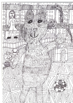
Edelényi Flóra 5.a