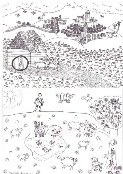
Szentesi Dóra 2.b