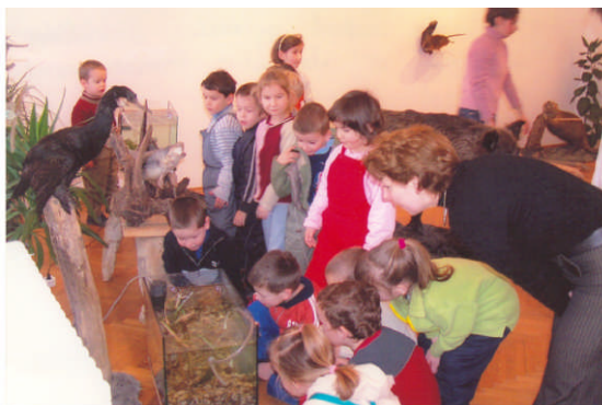
A képen a Hóvirág csoport látható.

Már tavaly is voltunk a „Pisztráng-kör” interaktív kiállításán a kastélyban. Nagyobb gyermekeink már kíváncsian készültek az idei találkozásra. A múlt heti alkalom újabb meglepetést szerzett: a kitömött vaddisznó, hód, pisztráng és az igazi halak, piócák lenyűgözték az óvodásainkat. A vaddisznó hátára még fel is lehetett ülni. Ki nem hagyta volna senki sem! A kiállításon még sok érdekességet láttunk a vízpart állatairól és növényeiről. Reméljük, hogy minden gyerek haza vitt magával egy szelet tudást. Jövőre is szeretnénk menni egy újabb kiállításra.