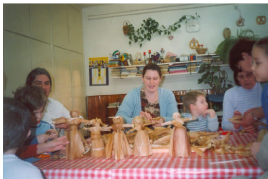
Készülnek a csuhébabák az Alma csoportban az Alma játszódélutánon.